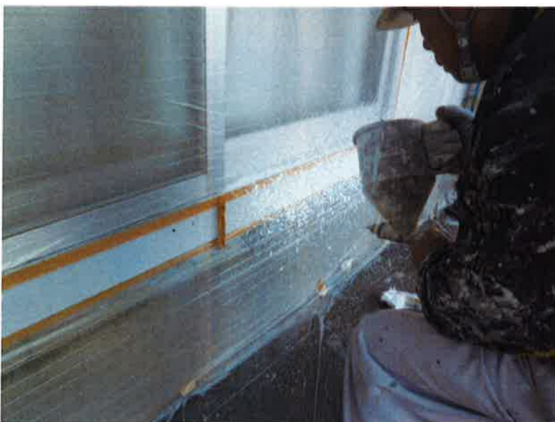
タカゲンアパート