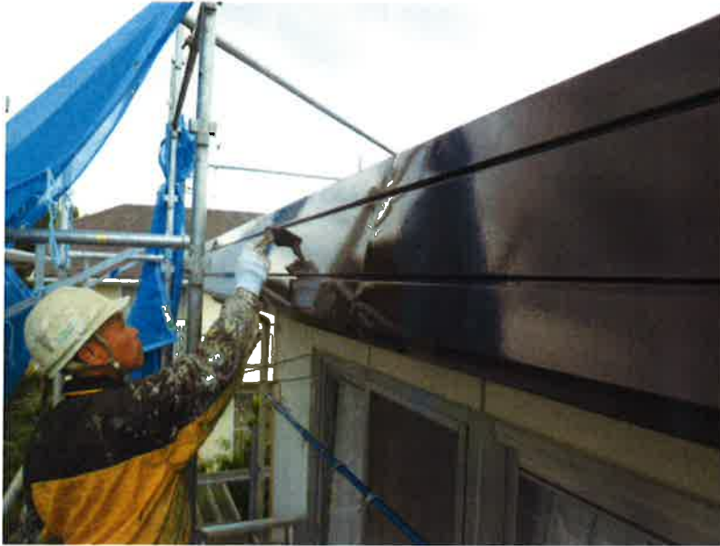
タカゲンアパート