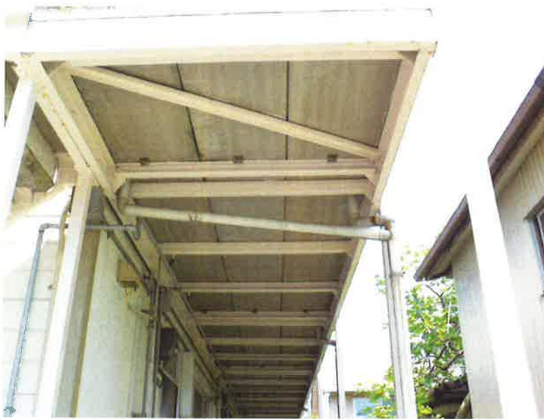
タカゲンアパート