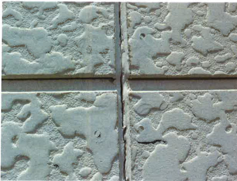
タカゲンアパート