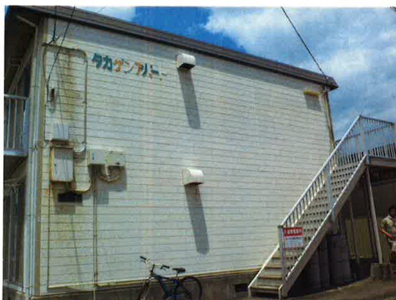
タカゲンアパート