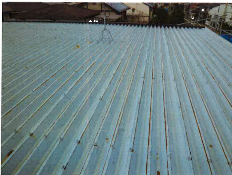
タカゲンアパート