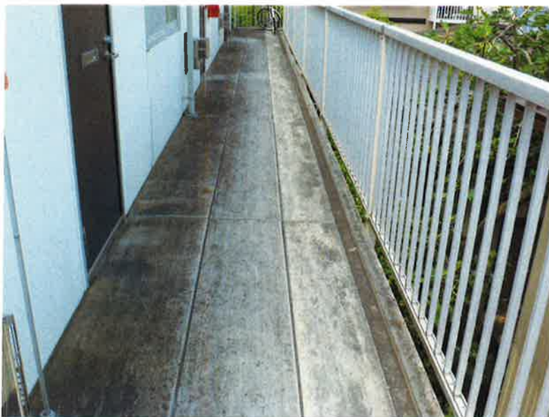
タカゲンアパート