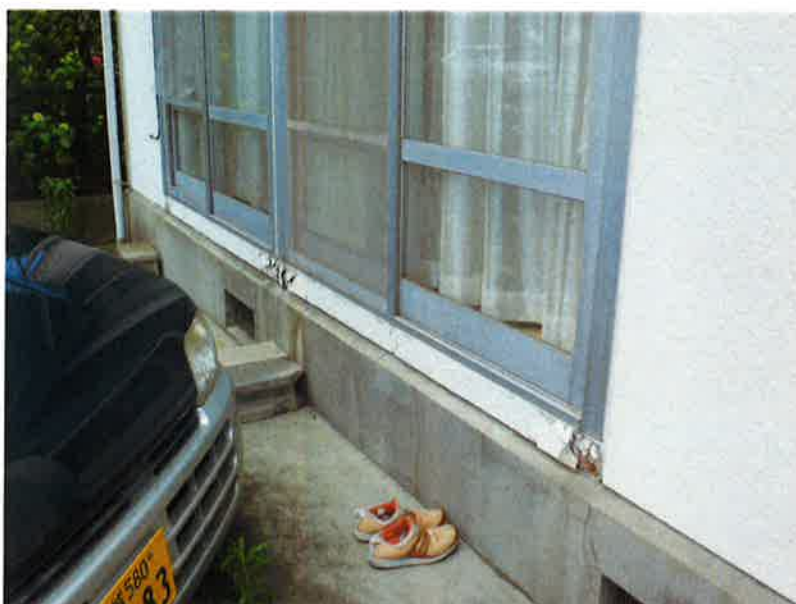
タカゲンアパート