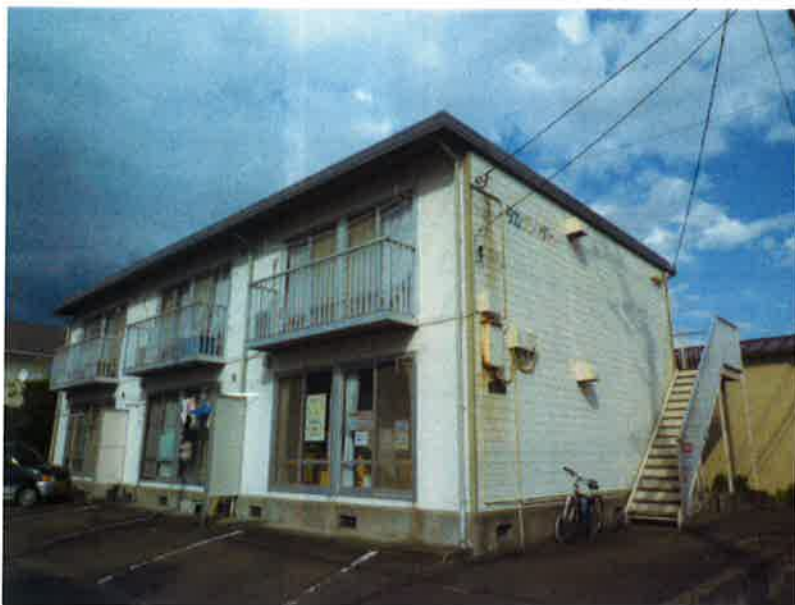
タカゲンアパート