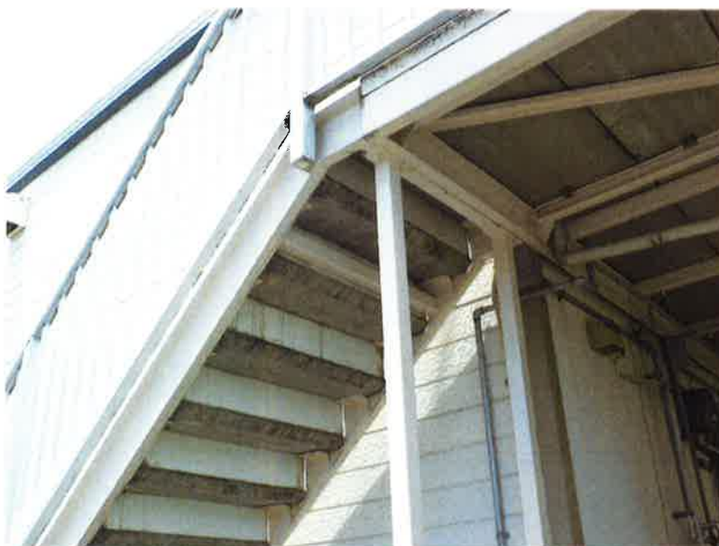
タカゲンアパート