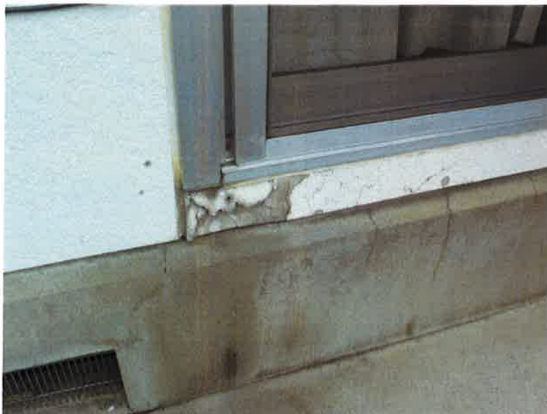
タカゲンアパート