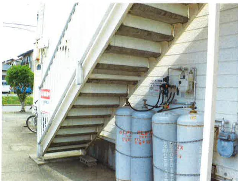
タカゲンアパート