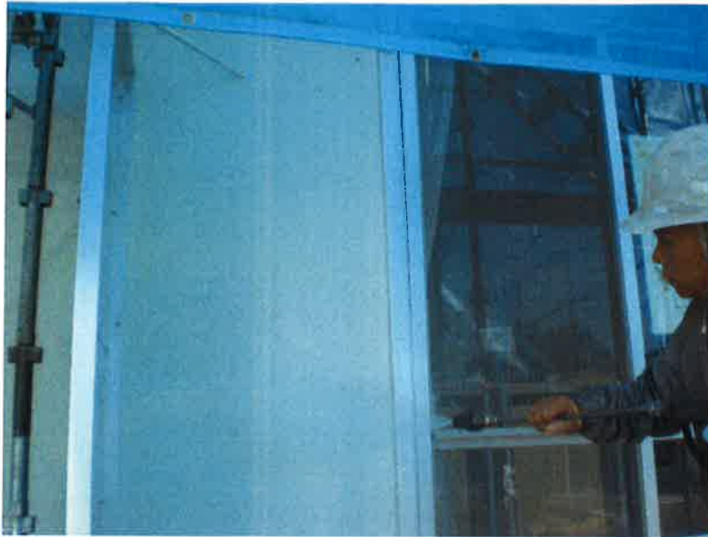
タカゲンアパート