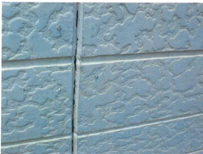
タカゲンアパート