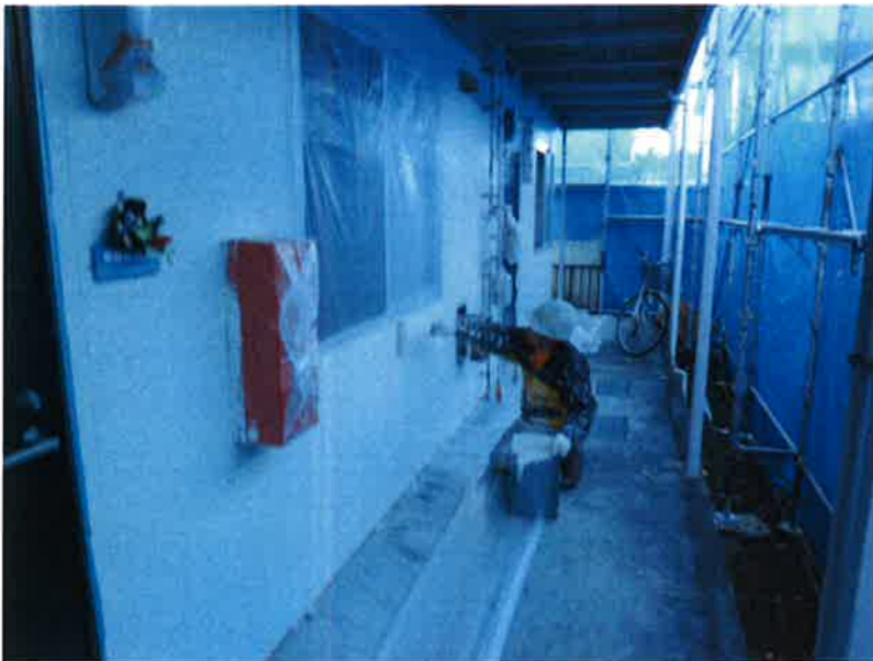
タカゲンアパート