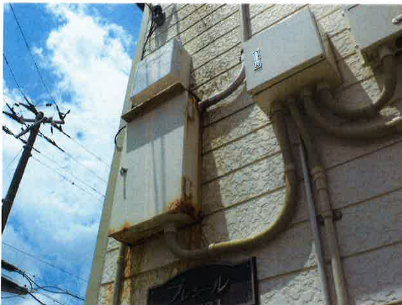
タカゲンアパート