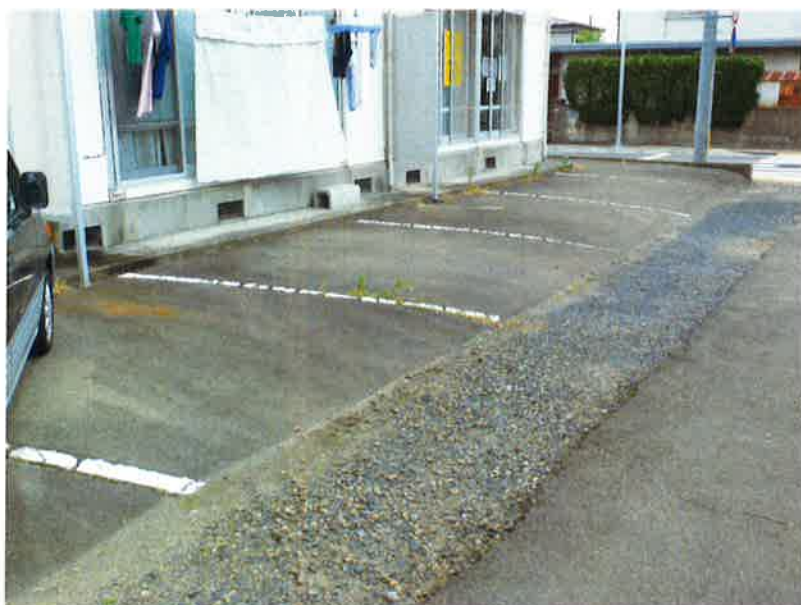
タカゲンアパート