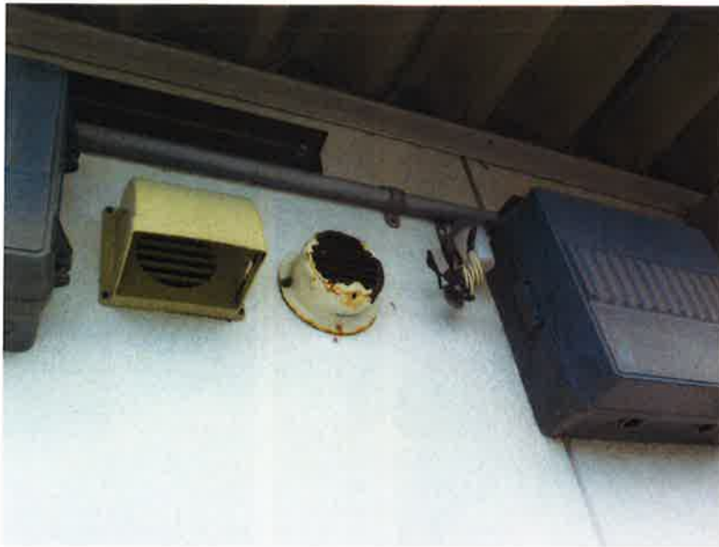
タカゲンアパート