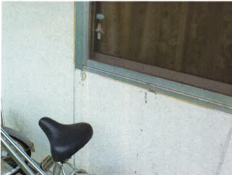
タカゲンアパート