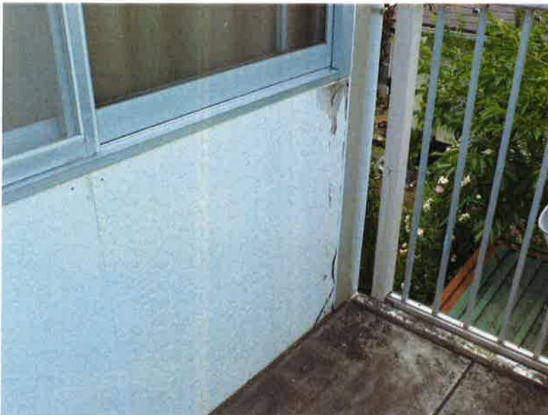
タカゲンアパート