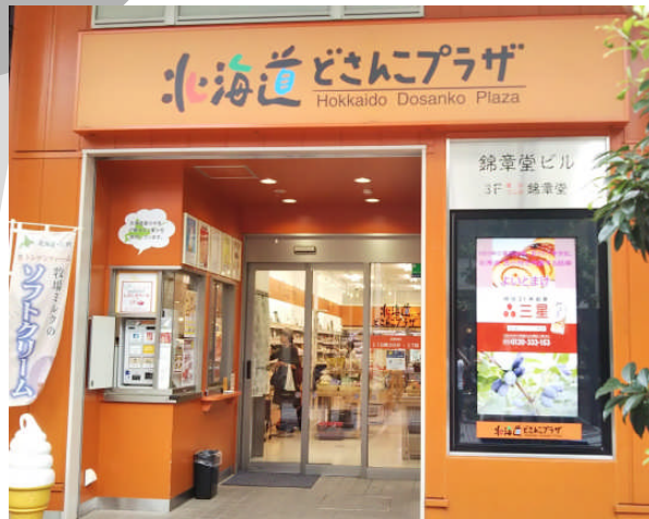
どさんこプラザ仙台店 青葉区一番町

北海道で主役なグルメと言えば・ カニ、ジンギスカン、札幌ラーメンと、 メジャースターがそろっていますよね。