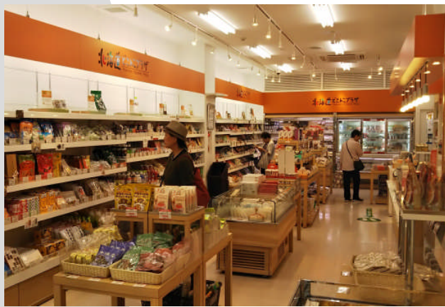
2018年は北海道命名150年

映画アベンジャーズで例えれば、カニ・ジン ギスカン・札幌ラーメンが人気の主役級。 スープカレーはブラックパンサーのように 脇役っぽいけど、実は地元じゃすごい人気の 影の実力者といった感じでしょうか。